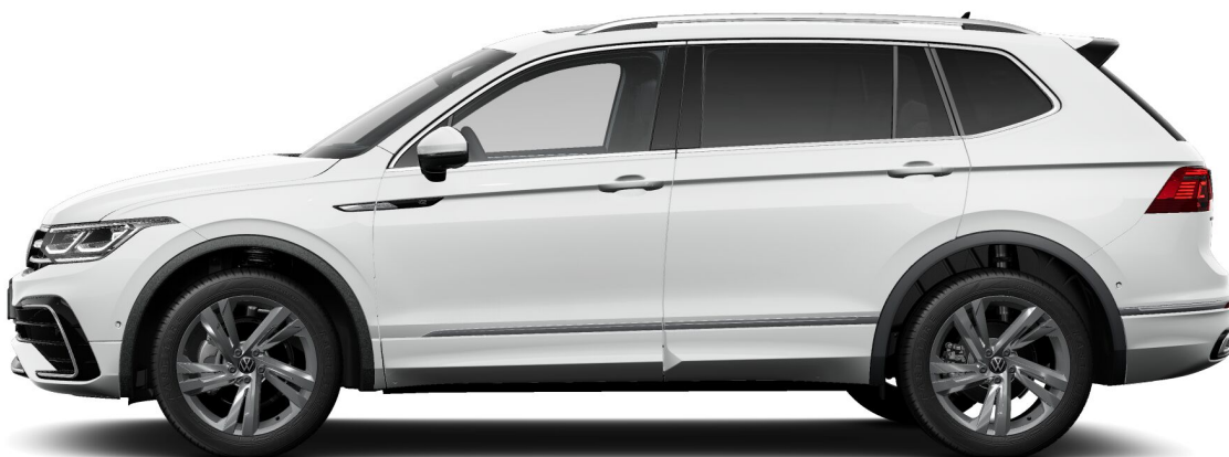
Tiguan Allspace R-Line 2.0 TDI SCR 8 CV 150 CH DSG 7